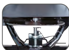
Disque et palettes en acier inoxydable