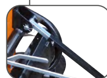
Timon réglable en hauteur